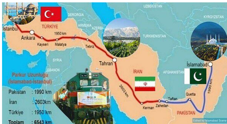
تصویر شماره ۲- مسیر ریلی ۶۰۰۰ کیلومتری پاکستان-ایران-ترکیه

در حال حاضر چند مسیر پروازی شامل تهران-اسلام‌آباد، تهران-کراچی (ایران ایر)، تهران-لاهور (ماهان)، مشهد-لاهور (تابان و ماهان) برقرار است که با توجه به حجم ورود و خروج سهم بسیار کمی در مسافرت‌ها داشته و لزوم گسترش آن احساس می‌شود (Hosseini, 2020). راه‌اندازی راه‌آهن تفتان-کوئته می‌تواند زمان رفت‌وآمد میان دو کشور را به میزان چشمگیری کاهش داده و مبادلات انسانی را افزایش دهد. در کنار محورهای فوق، تقویت کریدور ریلی پاکستان-ایران-ترکیه که می‌تواند بخش بزرگی از حمل‌تجارت مشترک میان سه کشور را شامل شود، می‌بایست در اولویت همکاری‌های ترازیتی سه کشور قرار گیرد.