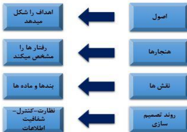
شکل ۱. چارچوب رژیم‌های بین‌المللی

یکی از مهم‌ترین اهداف اعمال رژیم‌ها، مقوله «حکمرانی جهانی» ۱ است. «حکمرانی جهانی خواستار تغییر موقعیت قدرت درزمینه تلفیق و چندپارگی است. روزنا، این روند را به‌عنوان یک گرایش فراگیر توصیف می‌کند، که در آن تغییرات عمده در موقعیت و وضعیت اقتدار و قدرت و مکان مکانیزم‌های کنترل در همه قاره‌ها صورت می‌گیرد. تغییراتی که در اقتصاد و سیستم اجتماعی به وقوع پیوسته به همان اندازه در سیستم سیاسی، آشکارند. روزنا حاکمیت جهانی را به‌عنوان «سیستم حکومت در تمامی سطوح» تعریف می‌کند- از خانواده تا سازمان بین‌المللی- که به‌واسطه آن اهدافی که از طریق اعمال کنترل تعقیب می‌شوند نتایج فراملی در پی دارد» (Weiss, 2000). یا کاکس حاکمیت جهانی را این‌گونه توصیف می‌کند که « روندها و رویه‌هایی که در سطح جهانی (یا منطقه‌ای) برای مدیریت امور سیاسی، اجتماعی و اقتصادی وجود دارند» (Thérien & Pouliot, 2017).