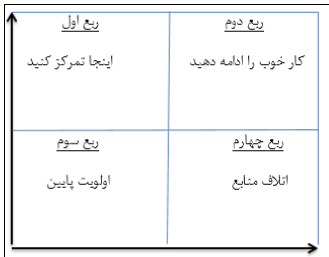
شکل (۲) - تحلیل عملکرد-اهمیت ماتریس دوبعدی

ربع اول (اینجا تمرکز کنید). مشخصه‌های ادراک‌شده برای پاسخ‌دهندگان بسیار مهم هستند، اما سطح عملکرد به نسبت پایین است. این ربع ضعف اساسی سازمان را نشان می‌دهد، بنابراین نیازمند توجه فوری برای بهبود است. نکته اساسی این است که ناتوانی برای شناسایی مشخصه‌ها در این ربع، موجب رضایت پایین مشتری می‌شود. در حقیقت تلاش برای بهبود باید در بالاترین اولویت قرار گیرد؛ زیرا ضعف اساسی در این ناحیه است.