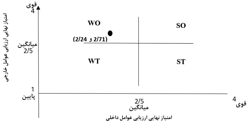
شکل ۲. ماتریس استراتژی‌ها و اولویت‌های اجرایی SWOT