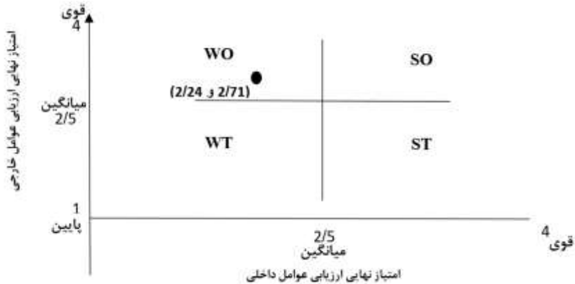
شکل ۳. ماتریس استراتژی‌ها و اولویت‌های اجرایی SWOT