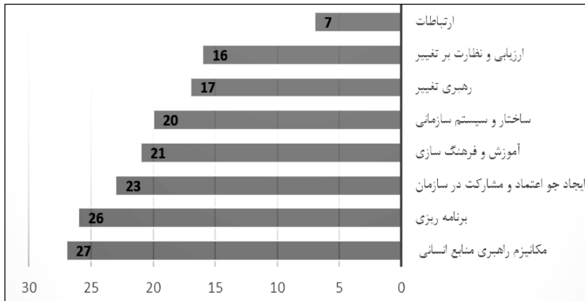
شکل (۵) - تعداد کدهای مرتبط با هر کد محوری

به منظور سنجش اعتبار نتایج حاصل از تحلیل محتوا، از پژوهشگر دیگری خواسته شد به صورت تصادفی ۱۰ درصد از داده‌ها (شناسنامه‌های تحقیق و مصاحبه‌ها) را کدگذاری کند. نتایج کدگذاری مجدد بر اساس آزمون اسکات، مورد سنجش قرار گرفت و مقدار آماره آزمون ۹۵،۶۵ درصد برآورد شد که نشان‌دهنده توافق نظر بالای کدگذاران در فرایند کدگذاری بوده است. شیوه محاسبه این آماره به شرح زیر است: