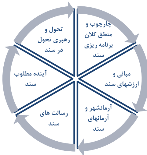
شکل ۳. مدل ساختاری الگوی اسلامی- ایرانی پیشرفت (عیوضی، ۱۳۹۵)

از بعد برنامه‌ریزی، الگوی پیشرفت تجلی خاصی از «برنامه‌ریزی بلندمدت» است که جریان آگاهانه انتخاب و تعیین اولویت‌ها به منظور تصمیم‌گیری آینده‌نگرانه را ترسیم و تبیین می‌نماید. در همین زمینه، یعنی برنامه‌ریزی راهبردی، مفهوم «آینده‌نگری» نیز قابل توجه است. به عبارت دیگر، در فضای تفکر راهبردی، مفهوم مرتبط با تصویرسازی، چشم‌اندازسازی و رویکردهای توصیفی راهبردی دارای اهمیت فراوانی است. براین‌مبنا، هرچند برنامه‌ریزی راهبردی به عنوان اجراکننده تفکرات راهبردی و در راستای به مرحله عمل رساندن راهبردهای حاصل از تفکر راهبردی می‌تواند نقشی حیاتی ایفا کند، آینده‌نگاری نیز به دلیل برخورداری ذاتی از تناسب لازم با ویژگی‌های تفکر راهبردی، در حجم گسترده‌ای به رفع نیازهای این سنخ تفکر قادر خواهد بود (کرامت‌زاده، ۱۳۸۷: ۱۳۵).