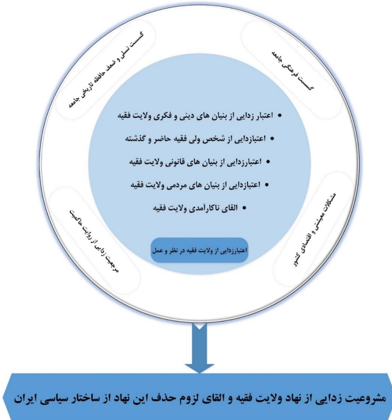
شکل ۲. طرح شماتیک راهبردهای مشروعیت‌زدایی از ولایت فقیه در رسانه‌های بیگانه فارسی‌زبان

پیشنهاد پژوهش حاضر، برای مقابله با عملیات روانی این رسانه‌ها در زمینه تصویرسازی از نهاد ولایت فقیه، این است که باید روایت واقعی که تاکنون از سوی نظام جمهوری اسلامی صورت پذیرفته؛ تقویت شده و در ذهن ایرانیان بازسازی آن صورت گیرد. باید توجه داشت که نهاد ولایت فقیه، به‌عنوان بنیادی‌ترین رکن سیاسی در جمهوری اسلامی ایران، نیازمند حراست و صیانت ویژه است زیرا بیشترین حمله‌ها و تخریب‌ها توسط دشمنان انقلاب اسلامی، به سمت این نهاد هدف گرفته شده است. در این زمینه، نیازمند عزم جدی حاکمیت برای مدیریت تصویر نهاد ولایت فقیه در اذهان مردم هستیم. عزمی که تمامی ارگان‌ها و دستگاه‌های مرتبط با این نهاد هستیم. از یک‌سو حاکمیت باید با به