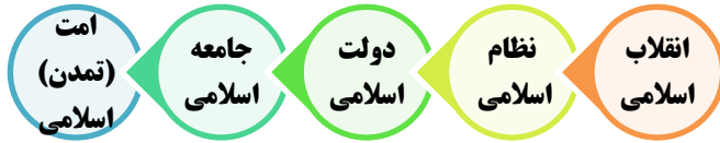
شکل ۱. مراحل ساخت تمدن اسلامی از دیدگاه مقام معظم رهبری

رهبر معظم انقلاب معتقدند که ما در مرحله سوم یعنی تشکیل دولت اسلامی و ساخت کشوری اسلامی هستیم، در همین رابطه ایشان می‌فرمایند: «ما در مرحله سومیم؛ ما هنوز به کشور اسلامی نرسیده‌ایم. هیچ‌کس نمی‌تواند ادعا کند که کشور ما اسلامی است. ما یک نظام اسلامی را طراحی و پایه‌ریزی کردیم و الان یک نظام اسلامی داریم که اصولش هم مشخص و مبنای حکومت در آنجا معلوم است. مشخص است که مسئولان چگونه باید باشند. قوای سه‌گانه وظایفشان معین است. وظایفی که دولت‌ها دارند، مشخص و معلوم است؛ اما نمی‌توانیم ادعا کنیم که ما یک دولت اسلامی هستیم؛ ما کم داریم. ما باید خودمان را بسازیم و پیش ببریم» (بیانات در دیدار کارگزاران نظام، ۱۳۷۹/۰۹/۱۲). اکنون مرحله تشکیل دولت اسلامی است و یکی از نقاط مهم و مؤثر شکل‌دادن به یک دولت اسلامی، داشتن کارآمدی لازم برای دولت بوده که سبب مشروعیت ثانویه کافی برای حکومت نیز می‌شود. این کارآمدی باید به‌صورت بومی‌شده در جهت رسیدن به اهداف کشور و سعادت ملت عمل نماید. اطلاع از سیاست‌ها و راهبردهای لازم جهت ارتقای کارآمدی نظام اسلامی به جامعه نخبگانی و مردم کمک می‌کند مطالبات دقیق‌تری داشته باشند و رسیدن به شایسته‌سالاری در انتخاب مدیران نیز به تحقق نزدیک شود.