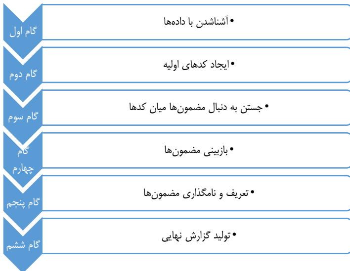
شکل ۴. فرایند تحلیل مضمون از منظر براون و کلارک

برای انجام پژوهشی با روش تحلیل مضمونی سه مرحله اساسی را باید پشت سر گذاشت؛ نخست، تجزیه و تعمیق در متن، سپس بررسی متن و کدگذاری و در مرحله نهایی بازسازی و تولید گزارش نهایی. برخی مثل براون و کلارک فرایند تحلیل مضمون را در شش مرحله توضیح داده‌اند: